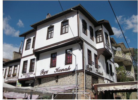
Resim 1. Beypazarı'nda restorasyonu yapılan konaklardan biri

başlatılan “Sokak Sağıklaştırma Projesi” kapsamında yenilenen 13 evin cephesinden sonra 2000 yılında dönemin Belediye Başkanı'nın öncülüğünde tarihî dokuyu korumak ve turizmi geliştirmek için “Beypazarı Yeniden Projesi” yürütülmüştür (Ecerel ve Özmen, 2009). Bu proje kapsamında gerçekleştirilecek 80 evin restorasyonu için maddi destek istenmesiyle başlayan projede, ilk olarak 25 ev restore edilmiş, başarı sağlanınca restorasyon çalışmalarına devam edilmiştir. Evlerde çatı kısımlarının restorasyonu ev sahiplerine bırakılarak bu kişilerin projeye katkıda bulunmaları ve evlere sahip çıkmaları sağlanmıştır. İlçede bulunan 3500 adet tarihî konutun restorasyonu ve sağıklaştırılması çalışması bu proje kapsamında ele alınmıştır. 2008 yılına dek bu evlerden 550 tanesinin restorasyonu bitmiş 283 bina için tescil alınmıştır (Nevzat Uzunoglu, kişisel görüşme, Ekim 2010).