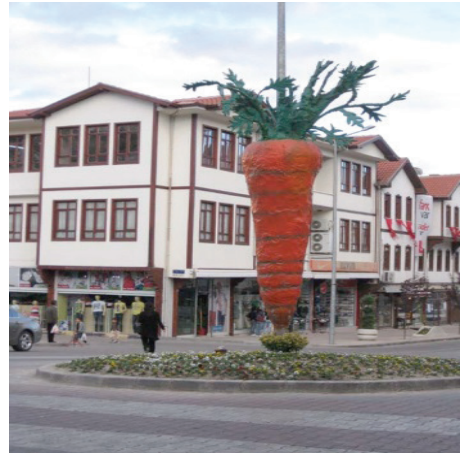
Resim 6. İlçe merkezindeki havuç heykeli

Beypazarı'nın kültür turizm konusunda öne çıkmasında en büyük paya sahip olan eski konaklara ilçede satılan hediyelik eşyalarda, gıdaların ambalajlarında ve kumaşların üzerindeki desenlerde de rastlanmaktadır.