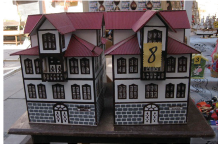
Resim 11. Beypazarı maket ev