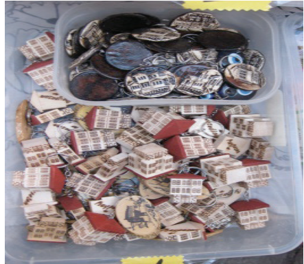
Resim 12. Beypazarı konakları anahtarlık

Beypazarı'nın kültürel mirasıyla tanıtılmasına dair yürütülen bir diğer faaliyet de hazırlanan rehber, katalog (İngilizce-Türkçe) ve broşürlerdir. 2006 yılında basımı tamamlanan katalogun içinde ilçenin tarihçesini, gezilecek yerlerini, yöresel yemeklerini,