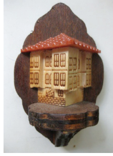
Resim 10. Beypazarı konakları buzdolabı süsü

Turistik hediyelik eşyada Beypazarı'nda 3 tip görülmektedir: Simgesel kısaltmalar (Beypazarı evi maketleri, buzdolabı süsü), işaretler (Beypazarı adının ve evinin deseni basılmış örtüler), yerel ürünler (bürgü, geleneksel yemekler, telkarılar) (Kara, 2011: 61).