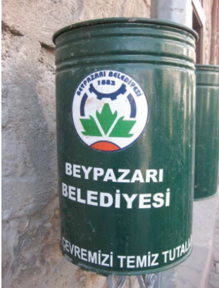
Resim 4. İlçedeki çöp kutuları

İlçenin logosu incelendiğinde, her ne kadar internet sitesinde “marka kent Beypazarı”, “turizm kenti Beypa-