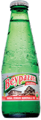
Resim 7. Beypazarı maden suyu şişesi