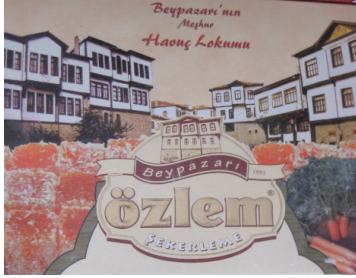
Resim 8. Havuç lokumu kutusu