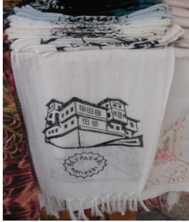
Resim 9. Beypazarı dokuması

Turistik hediyelik eşyada Beypazarı'nda 3 tip görülmektedir: Simgesel kısaltmalar (Beypazarı evi maketleri, buzdolabı süsü), işaretler (Beypazarı adının ve evinin deseni basılmış örtüler), yerel ürünler (bürgü, geleneksel yemekler, telkarılar) (Kara, 2011: 61).