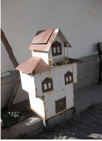
Resim 3. İlçedeki çöp kutuları

konusunda Belediye'nin uzun süredir devam etmekte olan çalışmaları mevcuttur. Ancak, kent mobilyaları konusunda özellikle oturma elemanı uygulaması ilçenin sokaklarının dar olması nedeniyle yapılmamıştır. Bunun dışında ilçede biri konak şeklinde, diğeri üzerinde Beypazarı logosu bulunan silindirik formda 2 tip çöp kutusu bulunmaktadır.