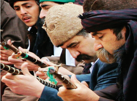
Resim-1: Ehl-i Hak Kelâmhânları.