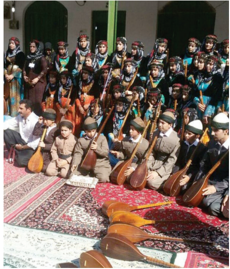
Resim-2: Ehl-i Hak Cemi, Yeni Yetişen Kelâmhânlar ve Elllerinde Tanburları.