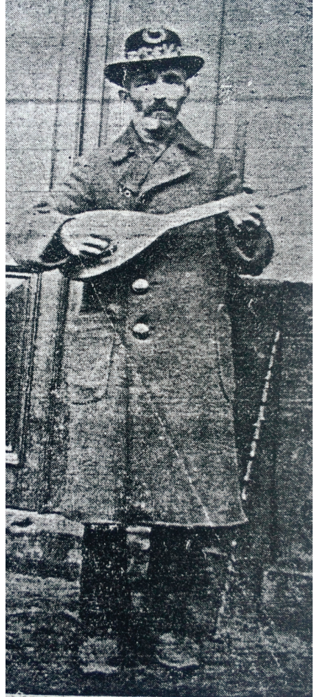
Fotoğraf 3