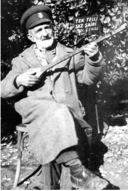
Fotoğraf 4 (17 Nisan 2017)