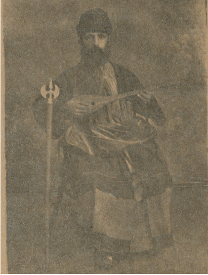
Fotoğraf 1 (Kaynak: Ahmed Cemâl. Beş Cemâli Müjdeli Cilveli Vatani ve Siyasi Amasya Destanı . İstanbul: Matbaa-i Hayriye, [ty].) (Ankara Millî Ktp 1994 AFİŞ 849)