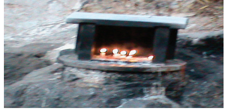
Foto 5: Kurban tığlanırken yakılan mum. Eski Türklerde kurban kesilirken ya da kötü ruhlardan korunmak için mum yakılmıştır. Tunceli/ Gole Çetu ziyareti.