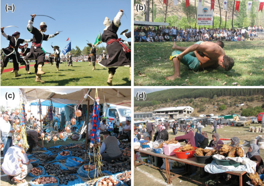
Resim-2: Geleneksel panayırlar geleneksel etkinlik ve üretimlerin sürdürülmesinde kültürel anlamda taşıma işlevi üstlenir. (a) Kılıç Kalkan ekibinin, Ertuğrulgazi'yi Anma Şenlikleri ve Söğüt panayırının açılış töreninde sergilediği gösteri; (b) Geleneksel Boyabat panayırında yağlı güreşler; (c) Pehlivan köyü'nde el yapımı hayvan çanları ve (d) Gerede panayırında kızarmış kaz geleneğini sürdüren köylüler.