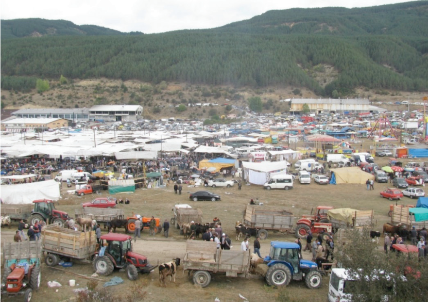
Resim-1: Gerede panayırından bir görünüm.