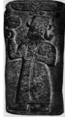
Levha 4: Birecik Kubaba Kabartması Akurgal 1961: Abb.115

yola çıkarak, bu betimlerde yer alan meyvenin uzun saplı olması, elde tutulma şekli ve taç yapısına dikkat çekilerek, bunların nar olmayıp, haşhaş olabileceği ihtimali üzerinde durmuştur (Levha 3-4). Hnila, haşhaş ve nar tasvirlerinin sıklıkla birbirine karıştırıldığını, daha önce nar olarak kabul edilen birkaç tasvirin, haşhaş olarak