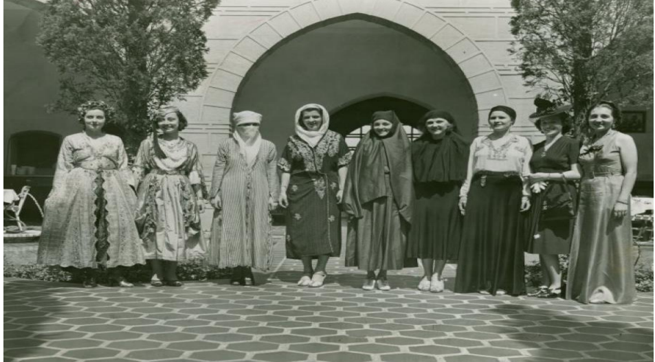
Fotoğraf 1: New York Sergisi'nde yer alan eskiden yeniye kadın kıyafetleri.