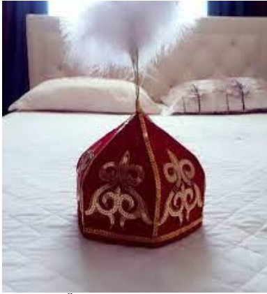
1. Ükü/takiya topu