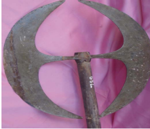
Fotoğraf 13: Teber, Madeni, Tarihsiz, Nevşehir Hacı Bektaş Veli Müzesi (N. Çevrimli)