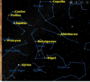
Fotoğraf 11: Orion ve Diğer Takımyıldızlar, Erişim Tarihi:18.12.2021