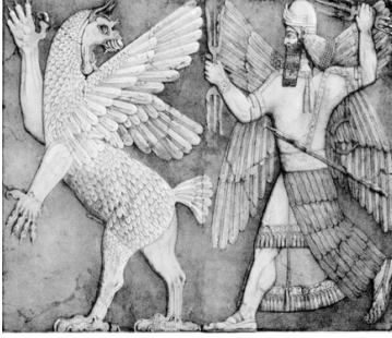
Fotoğraf 7: Marduk ve Tiamat, Rölyef, MÖ 9. Yüzyıl, British Museum, (wikipedia), Erişim Tarihi:18.12.2021