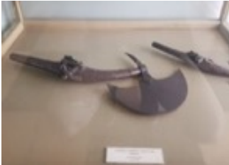
Fotoğraf 16: Kabzası Teber Şeklinde Bir Silah, Osmanlı Dönemi, Konya Etnografya Müzesi