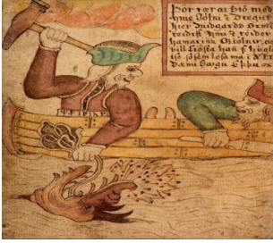
Fotoğraf 10: Thor Tasviri, Minyatür, 18. Yüzyıl, The Árni Magnússon Institute, Erişim Tarihi:18.12.2021