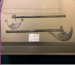
Fotoğraf 14: Teber, Madeni, Tarihsiz, Nevşehir Hacı Bektaş Veli Müzesi