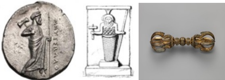
Fotoğraf 4: Zeus Labraundos, Gümüş Sikke, MÖ 377-353, ( https://explore.psl.eu/fr ), Erişim Tarihi:15.12.2021