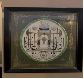
Fotoğraf 15: Teber Tasvirli Tezhipli Hat Levha, Tarihsiz, Nevşehir Hacı Bektaş Veli Müzesi