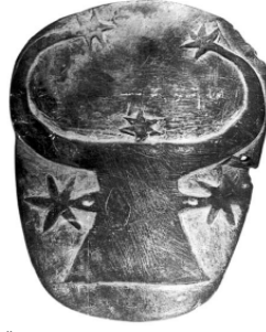
Fotoğraf 8: Hathor Haçı, Kabartma, Mısır Uygarlığı Hanedanlık Öncesi Dönem, (J. A. MacGillivray)