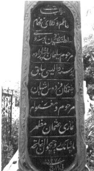
Resim 10: Lahit şeklinde mezar 4