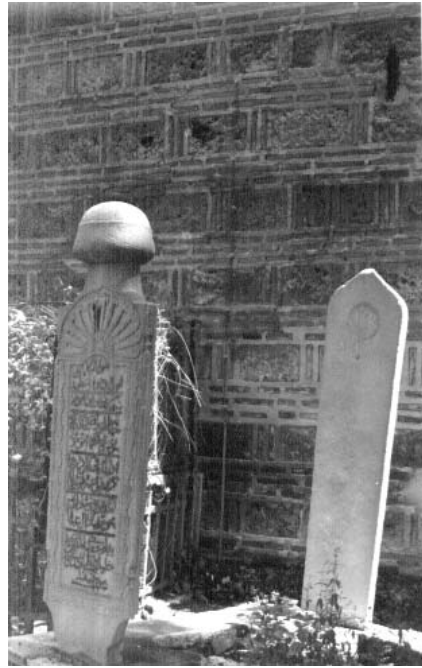
Resim 4: Lahit şeklinde mezar 2