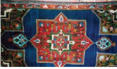
Şekil 6. "Yeminli" (mavi zeminli).

motiflerinin stilize edilmiş formları yer almaktadır. Kırmızı ve mavi ağırlıklı olmak üzere, yeşil, beyaz, siyah, sarı ve kahverengi kullanılan renklerdir (Şekil 5 ve Şekil 6).