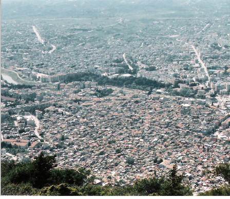
Antakya'nın genel görünüşü