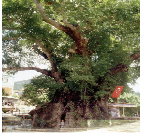
Hıdrbey Köyündeki ulu cınar (Samandağ)