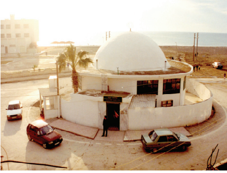
Türbenin etrafında arabayla dönenler (Hızır türbesi/ Samandağ)