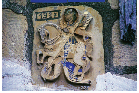
St. Georges (Mar corcus) tarafından ejderhanın öldürülmesi (Yoğunluk Köyü-Samandağ)