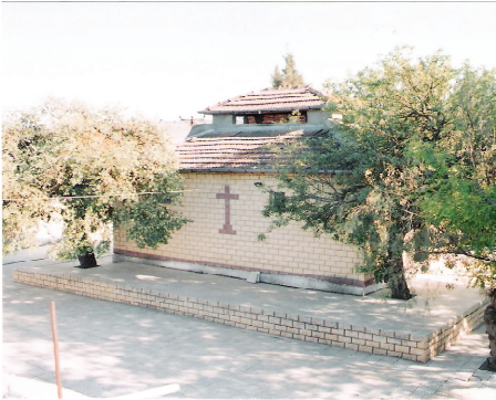
Mar Corcus türbesi (Sarılar/Altınözü)