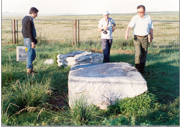
Moğolistan'da yazıtları incelerken