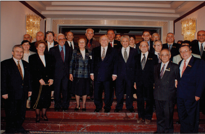
9. Cumhurbaşkanı Süleyman Demirel'le beraber bir heyette