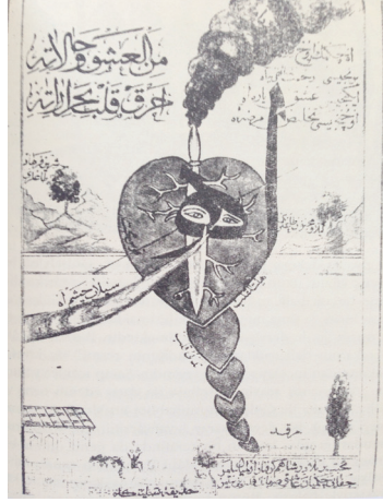
Ah Min'el Aşk

si somut ve somut olmayan kültürün bir arada değerlendirildiği günümüz yaklaşımlarına benzerdir.