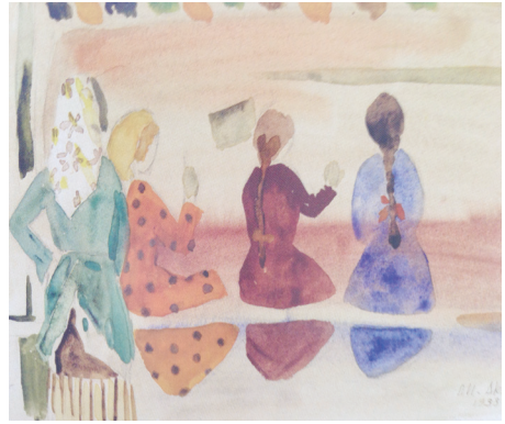
Halı dokuyan kızlar

Aksel’in sanat ve folklorla bütünsel yaklaşımını belirleyen etkenlerden biri de Almanya’da aldığı resim eğitimidir. Aksel, 1928 yılında iş ve resim pedagojisi eğitimi almak üzere Almanya’ya gönderilecek Darülmüallimin mezunlarını seçmek amacıyla açılan sınavı kazanır (Ayvazoğlu, 2011: 38). Malik Aksel Almanya’da kaldığı dört yıl boyunca kendisini Batılı anlamda resim ve resim eğitimi alanlarında eğitir. Aksel’in aldığı bu Batılı sanat eğitimi onun Anadolu ve Türk kültürüne bakışını daha da olumlu yönde geliştirmesine neden olur. Aksel’in resimleri ve halkın üret-